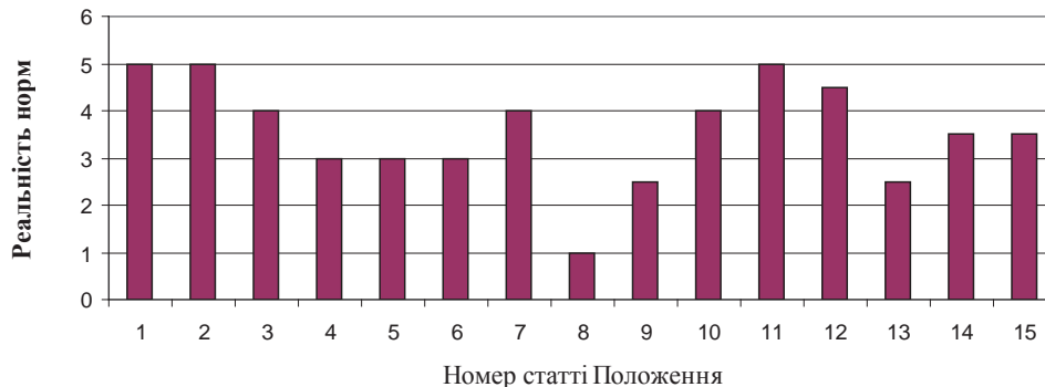
Рис. 2. Реальність правових норм Положення

Середнє значення авторської оцінки реальності правових норм Положення – 3,57, мода – 5, медіана – 3,5.