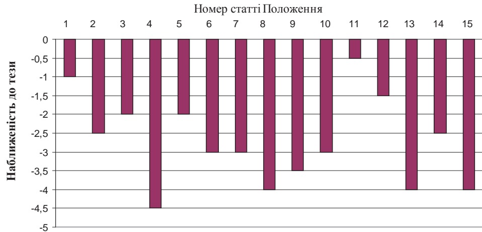
Рис. 3. Наближеність норм Положення до авторського погляду на оптимальну нормативно-правову регламентацію загальних зборів

Середнє значення авторської оцінки наближеності норм Положення до авторського погляду на оптимальну нормативно-правову регламентацію загальних зборів – 2,73, мода – 3, медіана – 3.